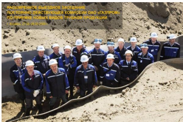
Работа в полевых условиях