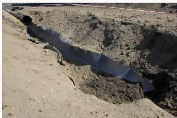
Особенности пластической деформации